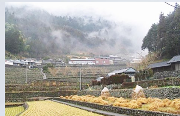
岡ノ内の山村の風景（高知県香美市物部町）

た時代のことが想像できる。空間的な境界は動植物や焼畑を分配する枠組みとなり、名を単位とする山村社会の秩序を支えたことだろう。しかしそれと同時に、自他の区別が無い、ありのままの空間は失われ、社会にとっては境界を維持することが目的化していく。現代の私たちが生きる空間は、テリトリーと境界で満ちあふれている。それは、空間的には有限の存在である人間が、空間を自身のテリトリーとして飼い慣らし、社会を秩序づけようと努めてきた結果である。