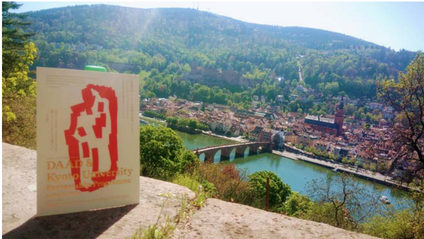
ドイツ・ハイデルベルグ