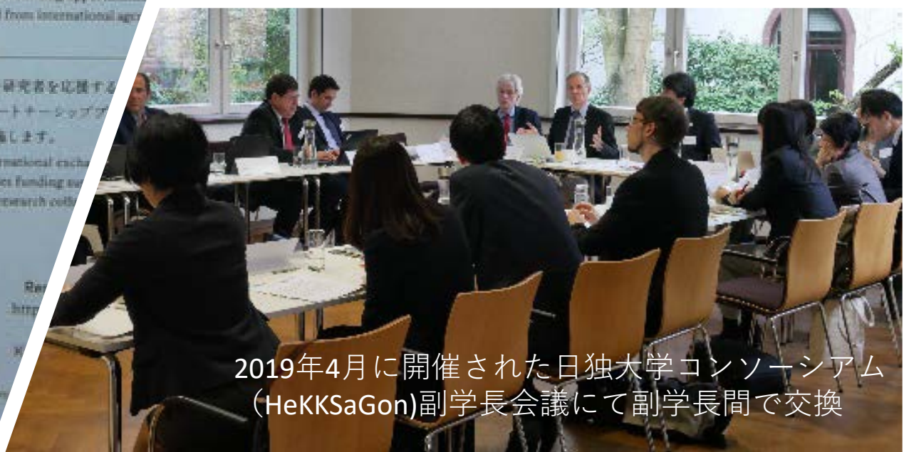
2019年4月に開催された日独大学コンソーシアム (HeKKSaGon) 副学長会議にて副学長間で交換

京都大学 国際研究センター https://www.iirc.kyoto-u.ac.jp/ 2019.3.26 京都大学国際交流センター https://www.oc.kyoto-u.ac.jp/ Toshiya Ueki, Tamiya Saito