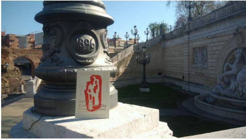
イタリア・ボローニャ